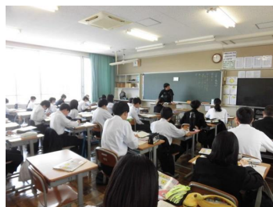
上は3年生の学年目標 下は2年生の様子

予習をして授業に臨む人、家に帰って今日の授業の内容をおさらいする人、はたまた何もしない人…それはさまざまであると思います。それぞれの学習方法や習慣があるでしょうから、「〇〇すべきだ！」とまでは言いません。しかし、授業の50分間は集中して、先生の話す内容をすべて頭に入れる…ぐらいの意気込みで臨んでみてはどうでしょうか？もし、先生の話す内容がわからないのであれば、授業後にでも先生をつかまえて、質問すればよいのです。きっと時間の許す限り、質問には答えてくれるはずですよ。学校では、50分を1限として、毎日だいたい5～6限の授業を行っています。ということは、毎日250～300分、つまり4～5時間の学習を行っています。これをおろそかにしてはもったいないですよ。せっかくそれだけの時間を費やすのですから、効果的な時間にしたいですね。そして授業というのは、学校生活でも最も大きな割合を占めています。つまり授業＝学校生活と言えるのです。各学年の目標にあった「授業を大切にする」ということは、皆さんの学校生活を大切にする…という意味にもなると思います。