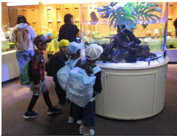
班での自由行動。2年生が上手に1年生をリードしてくれました。素晴らしい！

それでも、「大丈夫かな・・・」と気になるのが、教師の性分。こっそり後ろから、子どもたちの班行動を見てみると、2年生の子たちの細かな心遣いを感じることができました。「トイレ、大丈夫？」と1年生を気にかける姿、1年生の歩調に合わせてゆっくり歩く姿、班の全員が揃っているかその都度確認する姿・・・そんな姿が見られ、本当に頼もしく思いました。