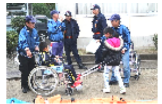
車いすの避難体験