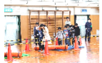
避難シミュレーションゲーム