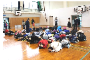
だんご虫のポーズ