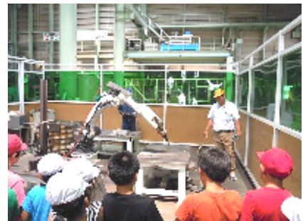
ロボットが溶接しているところ