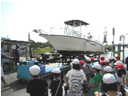
船をあげているところ

6月30日(月)は、3年生がゴーリキさんへ社会見学に行きました。まず、船をウインチで引き上げる場所を見せていただきました。その後、工場の中で、棚を作る行程の説明をしていただきました。鉄に穴をあけるパンチャーの機械や、溶接をするロボットを見て子どもたちは、驚いていました。