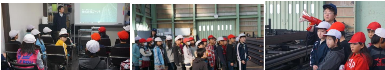
1月22日に3年生は、ゴーリキの工場見学に行き、最新の機械を見せていただきました。色々とお世話になりました。

3つ目は「いじめのない、みんなが笑顔でいることができる学校にしよう」です。いじめやいじめにつながることは学校でも家庭でも絶対にやらない強い気持ちを持ち、正しい行動をしましょう。よりよい学校生活がおくれるように、全校のみんなで努力をしましょう。