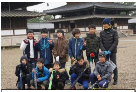
修学旅行スタートは法隆寺から。

保護者の皆さんには、旅行の準備や送り迎え等たくさんご協力いただき、ありがとうございました。皆さんのおかげで無事に修学旅行を終えることができました。