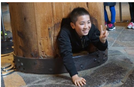
大仏の鼻の穴と同じ大きさの穴くぐり。思ったより大きい穴でした。