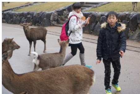
奈良公園。シカと楽しみました。