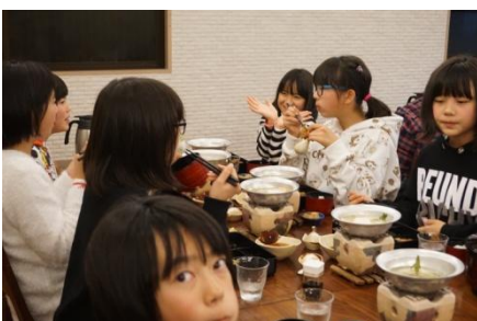
夕ご飯。楽しい雰囲気ですいつもよりたくさん食べていました。