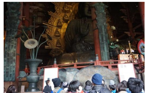
東大寺大仏の見学。大きくて驚きました。