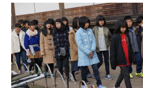
二条城のウグイス張りの見学へいざ！