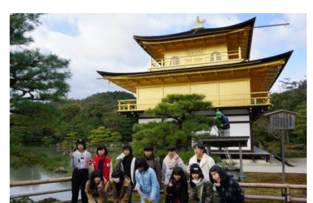
金閣寺は金ピカでまぶしかった！