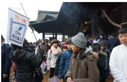
清水寺の舞台から下を見ると少し足がガクガクしました。12日に発表された「今年の漢字」が展示しており、本物を見ることができてラッキーでした。