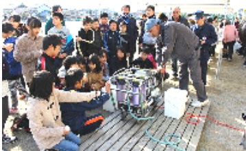
浄水器の使用方法