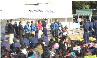
振興会会長あいさつ

昼食は、避難食のカレーライスで、とてもおいしかったです。また、蒸しパンも頂きました。振興会の方々、鈴工の皆さん、PTA役員さん、そして地域の皆様方、大変お世話になりありがとうございました。