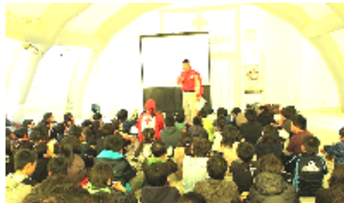
青少年赤十字防災プログラム学習