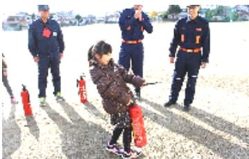
水消火器による消火体験