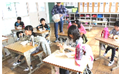
避難食のカレーと蒸しパン