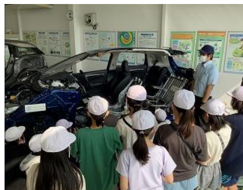
5年→ オートリサイクル センター