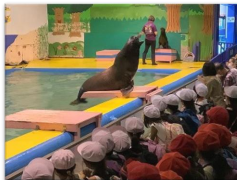
↑ 1年 伊勢シーパラダイス