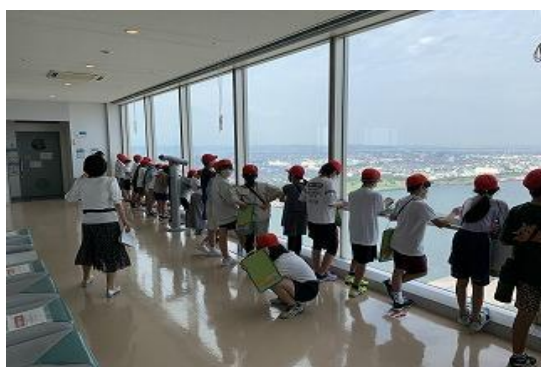
← 4年 ポートタワー