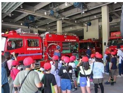
← 3年 消防本部