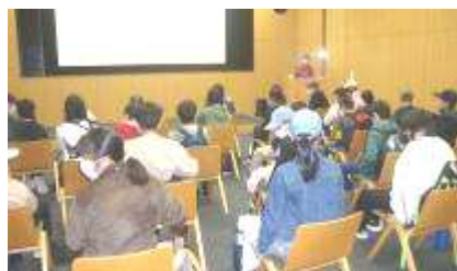
古道センターで学習

コロナウイルスの関係で、例年の奈良・京都ではなく、東紀州方面でした。とても楽しい夢のような2日間でした。