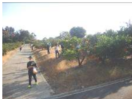
いいお天気で、みかん狩り