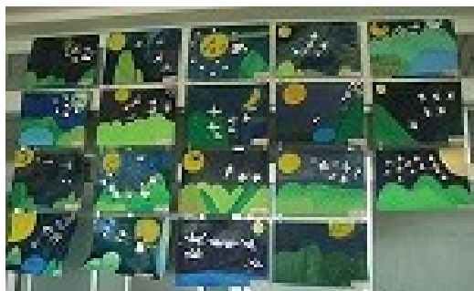
5年絵画「百羽のツル」