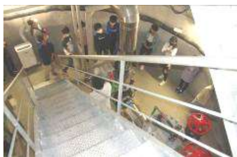
アクアステーション地下15mへ