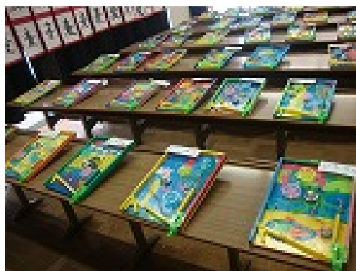
4年工作「コリントゲーム」