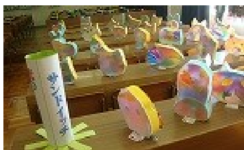
3年工作「光のサンドイッチ」