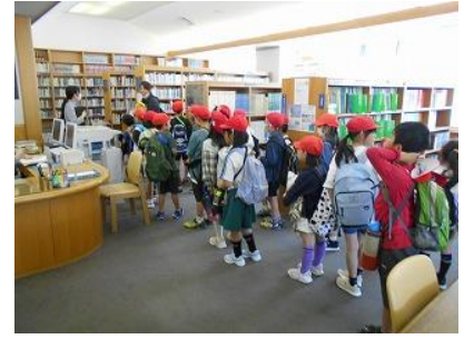
伊勢図書館、福祉健康センター、早修児童公園(3年生)