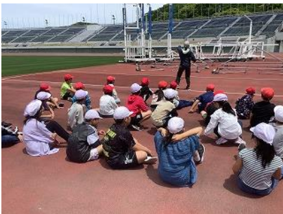
県営総合競技場(4年生)