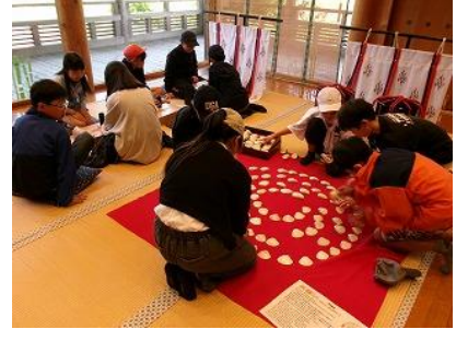
いつきのみや歴史体験館 斎宮歴史博物館(6年生)