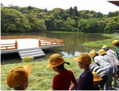
外宮勾玉池、岡本公園(1年生)

目的地では、ふだん学校ではできない学びを深めたり、友だちと一緒にお弁当を食べたり、自由時間にいっぱい遊んだりすることができました。