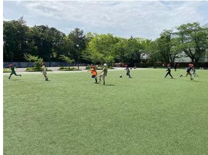
皇學館大学 芝生広場(2年生)