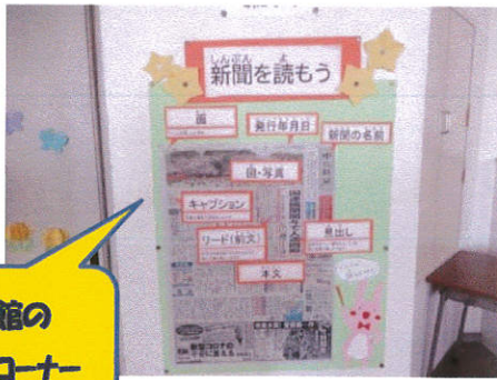
図書館の 新聞コーナー