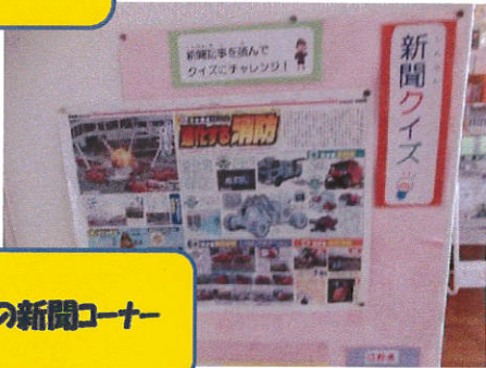
日刊の新聞コーナー