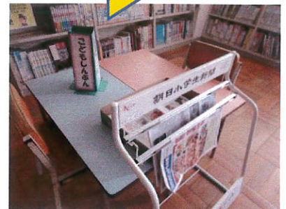
図書館の こども新聞コーナー

今年度と来年度、明倫小学校は日本新聞協会の「NIE実践指定校」となりました。新聞を無償で提供していただくなど、新聞に親しむ取り組みをしていきたいと思っております。