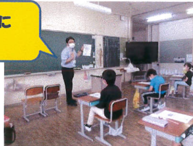
新聞と友だちに なろう！！

また、2年生以上の学年を対象に、朝学習などでの「新聞学習」もスタートしました。月に1回程度となりますが、新聞記事を使って5W1Hを拾い出したり、自分の感想を書いたりの作業をするため、校長の私が各学級を回らせていただきます。どんな記事が登場するか、楽しみにしてください。