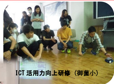
ICT 活用力向上研修 (御菌小)