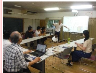
第 1 回情報教育研究会の様子