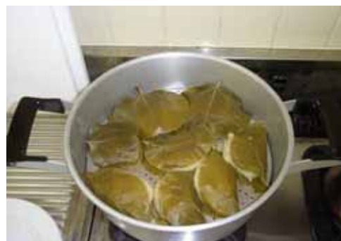
みんなで作ったいばら餅