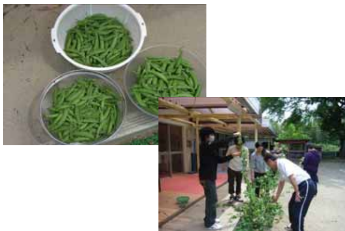
スナップエンドウの収穫

「NEST」は、学校へ行きたい、または行かなければならないと思っていても行くことができずに悩んでいる子どもたちのためにあります。子どもたちが様々な活動、体験を通してエネルギーを蓄え、自立して学校復帰できるよう支援していきたいと思っています。(平成23年5月17日・記)