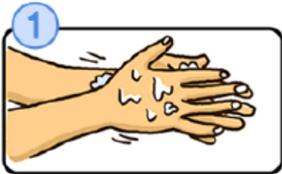
流水でよく手をぬらした後、石けんをつけ、手のひらをよくこすります。

石けんで洗い終わったら、十分に水で流し、清潔なタオルやペーパータオルでよくふき取って乾かしましょう。