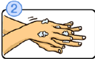
手の甲をのばすようにこすります。