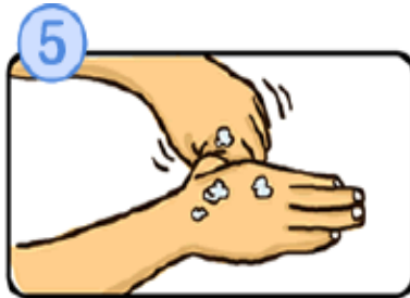
親指と手のひらをねじり洗いします。