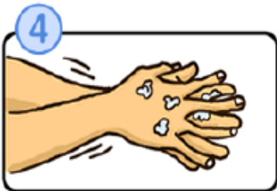
指の間を洗います。