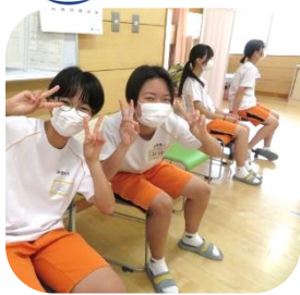
3年生の内科検診中