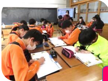
英語の授業の様子（3年生）