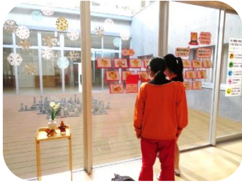
「健康おみくじ」登場！