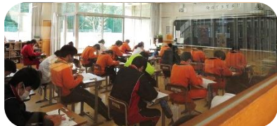
テスト中の3年生(ガラス越しです)