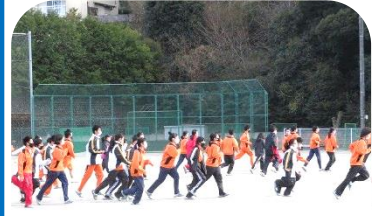
1月7日の避難訓練の様子