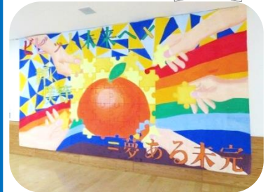
間近で見るとさらにすばらしい！