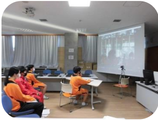
12月1日 子ども人権フォーラムの様子