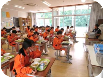
給食は「黙食」で。 しっかりと食べていただきます。