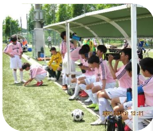
ハーフタイムのベンチで