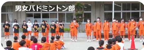
男女バドミントン部