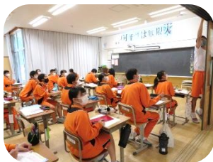
上の窓を開けてくれるのは 3年生ならではです！