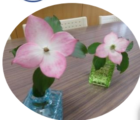
ヤマボウシ 花言葉は「友情」