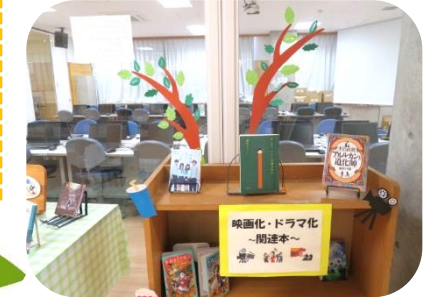
「映画化・ドラマ化された本」のコーナー