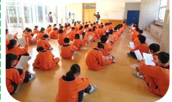
iPadの持ち帰りガイダンス

「未来に向かって 自ら学び 高め合い たくましく生きる生徒」を目標に、全校のみんなが少しずつ前進していくことが、先生たちの願いです。