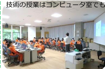
技術の授業はコンピュータ室でも