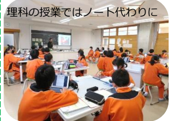
理科の授業ではノート代わりに