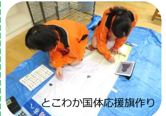
とこわか国体応援旗作り