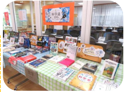
「科学道 100冊」のコーナー 理科が得意な人もちょっと苦手という人にもおススメ!

本校には週1回、図書館支援員の西本さんが勤務してくれています。様々な図書コーナーを企画して本の並べ方やポップ(本の紹介)も工夫してくれています。お気に入りの本を見つけて、宮川堤を眺めながら読書をする時間が作れたら、きっと心が安らぐと思います。友だちと入るもよし、一人で静かに時間を過ごすもよし!図書室で豊かな時間を体験してみてください。いいです。「コウノドリ」などシリーズで読める優れた漫画本もあります。ぜひ、足を運んでみてください☆