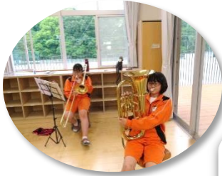
吹奏楽部パート練習中