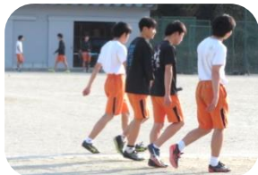
ますますの活躍を 楽しみにしています!