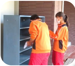
保健体育委員が活動中!