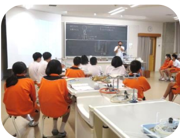
1年生理科の授業の様子 (理科室で)