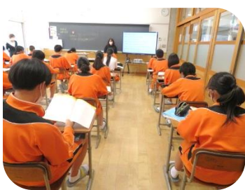
3年生英語の授業の様子 (学習室で)