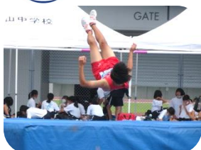
伊勢度会陸上の様子 クリア!(男子走高跳)