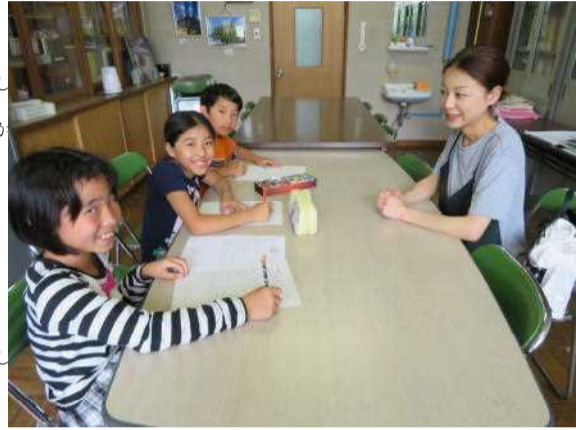
インタビューがんばってます！

歯科えいせい士さんのお母さんにお話を聞きました。歯科えいせい士は歯医者さんで先生のお手伝いをしたり、口の中をきれいにしたりする仕事をしています。まず歯には、むし歯・歯肉炎・歯しゅう病などの病気があることを教えてもらいました。むし歯は「さん」というよくないものが歯をとかしてできるものです。食べかすが歯にくっついていたり、それが「しこう」にな