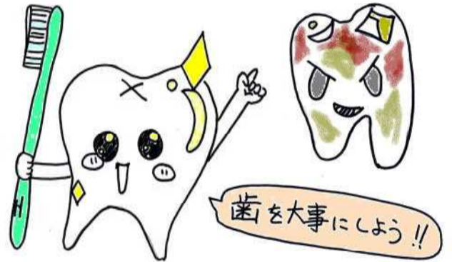
作：よしのり・よう・しおん