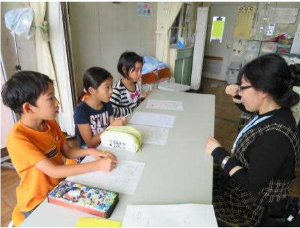
ピタ・コシヨみがきで。

「さん」を出してむし歯を作るので、①歯みがき②食べもの（あまいものを食べすぎない）が大事だそうです。歯みがきはスクラビング法がいいそうです。やり方は歯ブラシを歯に直角にあてて、細かく動かします。歯ブラシは毛先が細く小さなものがおすすめです。教えてもらったピタ・コシヨみがきと聞いて、と思いました。