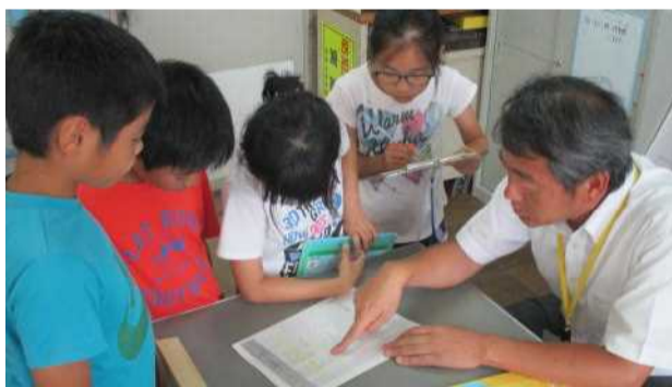
教頭先生から安全な場所と安全度ランクのリストを見せてもらいました。

消火せんやぼう火水 そうは地しんで火事が 起こったとき、役に立 ちます。放送せつびで、 情報を流すことができ ます。海ばつ表示を見 て、その土地の高さ を知っておくことも大 事だと思いました。