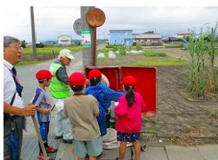
【2つのグループに分かれて校区を探検】