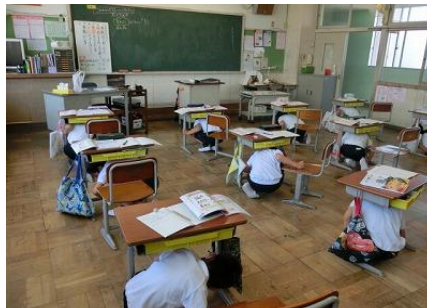
教室は机の下にもぐります。