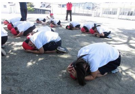
1・2年生ダンゴムシ姿勢上手です

現段階の研究によると、南海トラフ地震の発生率が70～80%とされています。いつ起きてもおかしくない地震にこれからしっかり対策をとっていきましょう。