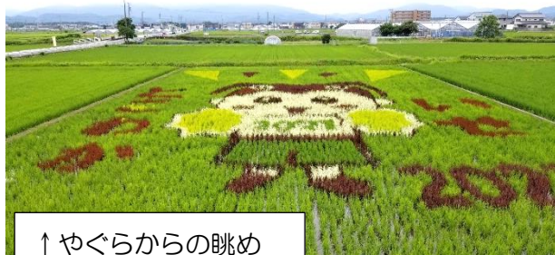
↑やぐらからの眺め

5年生が田植え作業をした田んぼアートが見頃を迎えました。今年も国体キャラクターのとこまる君のデザインです。7/25(日)まで、やぐらの上から見学できます。5年生が制作したかかしも立ててありますので、ぜひご覧ください。秋には5年生が稲刈りをする予定です。