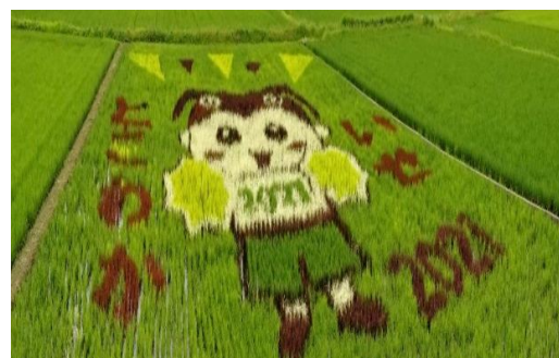
↑やぐらから撮った写真を加工したもの