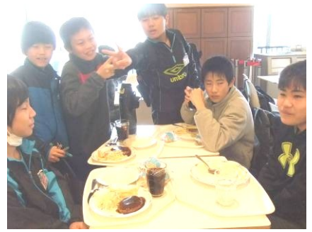
楽しい昼食風景 です(写真上3枚)