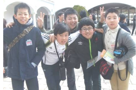
出発前の笑顔の各グループ (写真左、上)

当日は伊勢市内外合わせて19の小学校団体が入園中で、春のレジャーの家族連れも多く、混雑していましたが、子どもたちは次々とアトラクションを楽しみ、そして思い思いの昼食を摂り、各レストランやフードコートでくつろいでいました(写真裏面)。