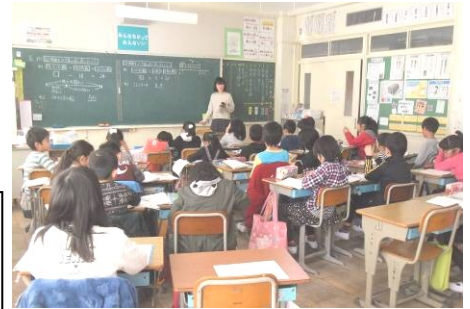
□の式を作り取り組む3B(上)