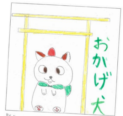
題名 おかげ犬とひるこいご

でした。みなさん、おめでとうございます。なお、表彰等は、来年5月の田植えの時です。