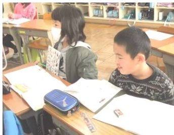
先生の説明を聴く3B(上)

「文章を読んで、式を作る」ために、数学的な考え方、文の読み取りの力を養うことが大切なんですね。中学校1年の数学・方程式の前の学習をしていますね。がんばれ、3年生。