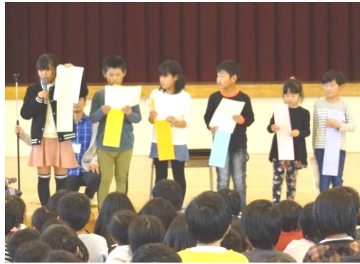
優秀作の発表（左から6年生、写真上左）