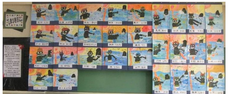
1年A組うちゅうへ行こう!(左) 2年B組しまひきおに(上)