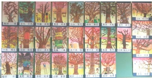
3年C組(上左) D組(上右) 木の实とり