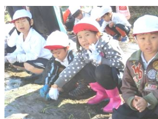
AB (左) CD (右)