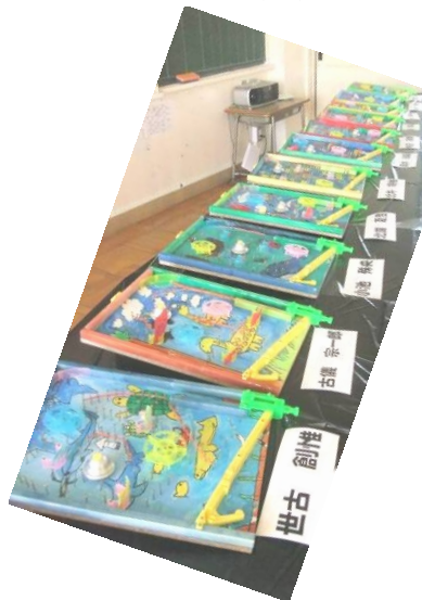
4年C組コリントゲーム (下)