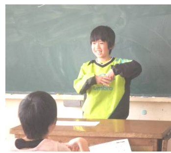
手話であいさつをする3B男子(左)手話で自己紹介の3Aと3C男子(中央と右)

「手話」は人と人とをつなぐコミュニケーションの一つです。今年度伊勢市は『手話言語条例』を策定し、4月1日に正式に施行となります。4月以降も、まだ手話を学んでいない学年だけでなく、一度学んだ学年でもより手話を広げる取組をしていきたいと思っています。