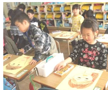
6年生の顔を描く1B(上)

3/26(土)から、春休みが始まります。1年生は2年生に、2年生は3年生に、・・・5年生は6年生最上級生へと進級する春休みです。桜の花も咲き、暖かくなり、戸外で遊びたくなる楽しみな9～10日間です。子どもたちは有意義に、そして、体調維持して過ごし、新しい学年・新学期を迎えてほしいと思います。